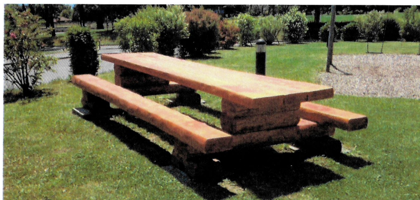
Figure 3: Illustration de la table de pique-nique

L'aménagement prévu pour la place de pique-nique consiste en une table en bois de 4m, fournie par un groupement forestier de la région, selon l'illustration ci-dessous :