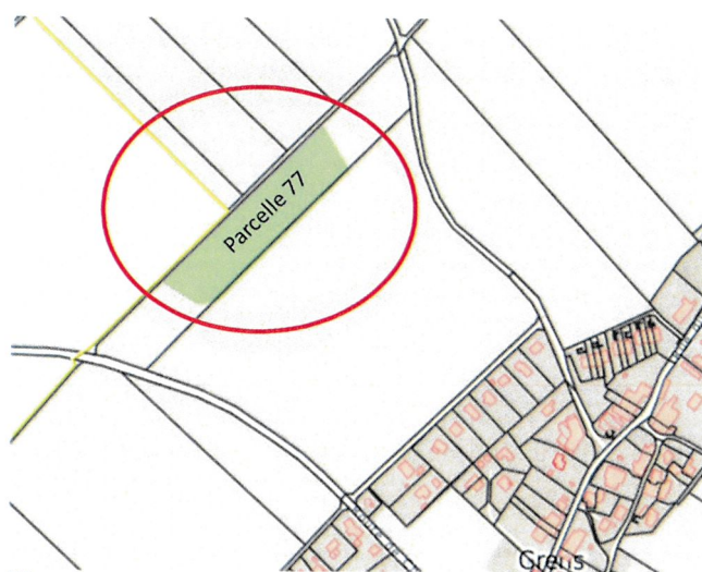
Figure 1: Plan de situation parcelle 77

Le but de ce projet est de réhabiliter ce petit bois afin que les habitants de Grens puissent en profiter. La Municipalité vous présente par ce préavis son projet de réaménagement de cette parcelle et le soumet à votre approbation.